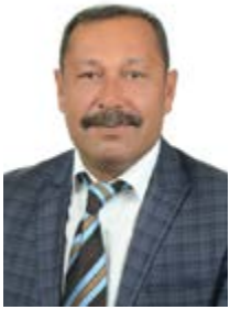
Suat ATALAY MECLİS ÜYESİ