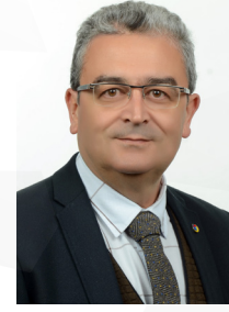
Ömer Faruk GÜNDÜZALP MECLİS ÜYESİ - TOBB DLG.