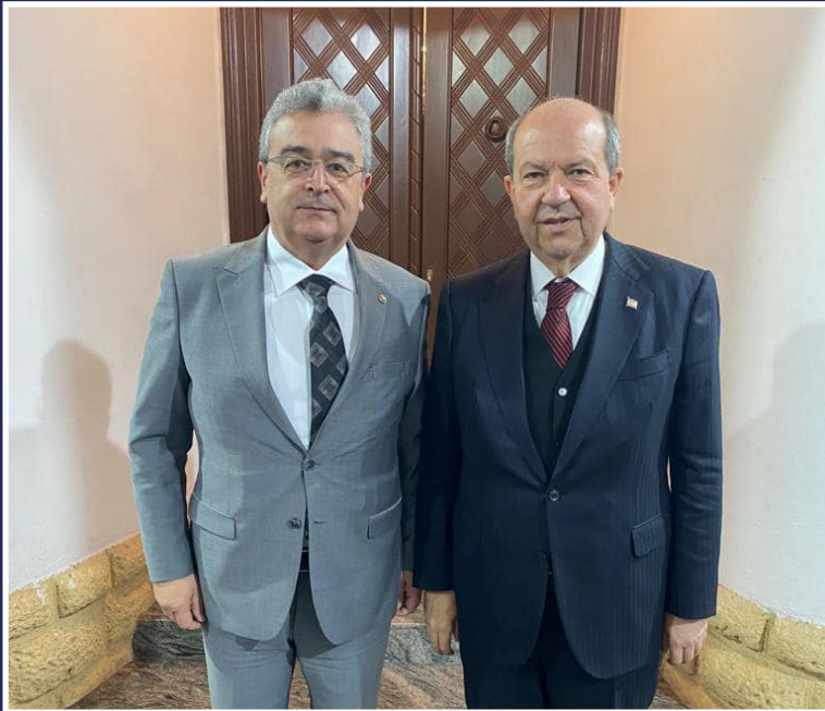
Başkanımız Ömer Faruk Gündüzalp, KKTC Cumhurbaşkanı Ersin Tatar ile bir araya geldi.

Y önetim Kurulu Başkanımız Ömer Faruk Gündüzalp, Burdur Ticaret ve Sanayi Odası Başkanı Yusuf Keyik, Türkiye Odalar ve Borsalar Birliği (TOBB) Başkanı M. Rifat Hisarcıklıoğlu, TESK Genel Başkanı Bendevi Palandöken, Türk-İş Başkanı Ergün Atalay ile birlikte, Kuzey Kıbrıs Türk Cumhuriyeti Cumhurbaşkanı Sayın Ersin Tatar ve Lefkoşa Büyükelçisi Metin Feyzioğlu'nu ziyaretlerinin ardından, Kıbrıs Türk Ticaret Odası'nda, iş insanları ile bir araya geldiler.