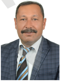
Suat ATALAY MECLİS ÜYESİ