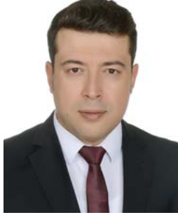
Bahtiyar TURAN BAŞKANLIK DANIŞMANI