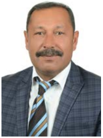
Suat ATALAY MECLİS ÜYESİ