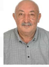
Ömer Faruk GÜNDÜZALP MECLİS ÜYESİ - TOBB DLG.